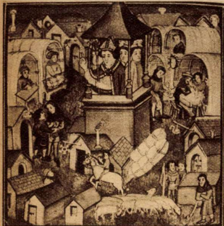
A párizsi nagyvásárt ábrázoló kép a XIII. századból

Eleinte főként a genovaiak, az Embriacik és az Uso di Mare nagy hajós és kereskedő dinasztiai álltak hajóikkal, tapasztalataikkal és nem utolsósorban pénzükkel a Kelet felé törekvő frank lovagseregek rendelkezésére.